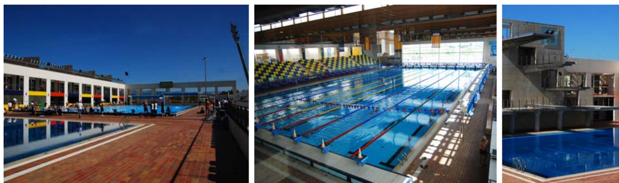
L'installation de la piscine Son Hugo de Palma de Majorque

Dans le cadre de la préparation terminale en vue d'un objectif majeur, avant d'entamer le processus d'affûtage, les sollicitations en compétition permettent de trouver les meilleures opportunités pour effectuer les derniers réglages "grandeur nature". Le but de l'action était alors de proposer aux meilleurs nageurs franciliens un déplacement dans une compétition de haut niveau, et leur permettre ainsi d'ouvrir de la meilleure manière possible leurs dernière période d'entraînement avant les championnats de France de Dunkerque.