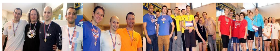
Quelques beaux doublés ou triplés des Franciliens