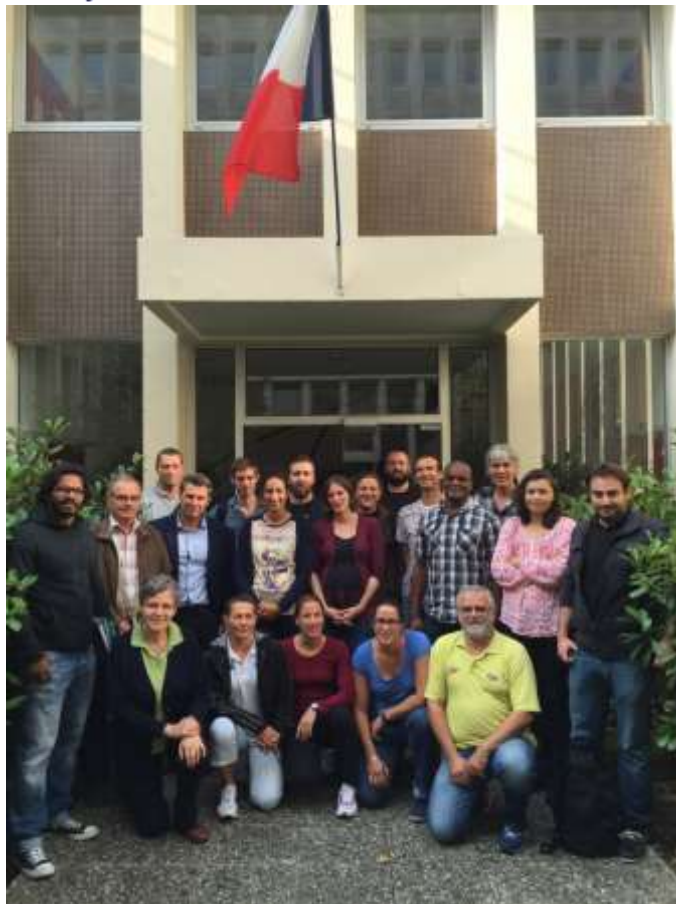
Journée régionale des « Référénts Techniques de Session ENF »

Vingt-cinq personnes ont participé dimanche 18 septembre à une journée dédiée aux « Référénts Techniques de Session ENF » ( Évaluateurs ENF responsables du bon déroulement de la passation des tests du Pass'sports de l'eau et du Pass'compétition ) qui s'est déroulée à la Direction Régionale de la Jeunesse des Sports et de la Cohésion Sociale d'Ile de France.