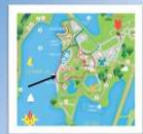
Sur l'île, plage Sud