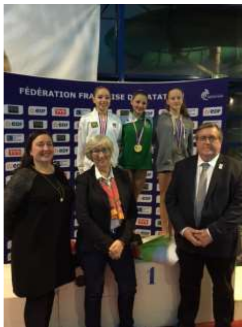
Podium « figures imposées » Jeunes Catégorie 2003-2004