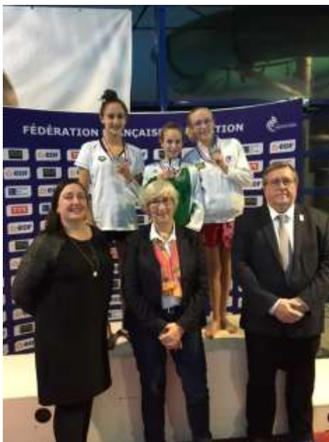
Podium « figures imposées » Jeunes Catégorie 2005-2006