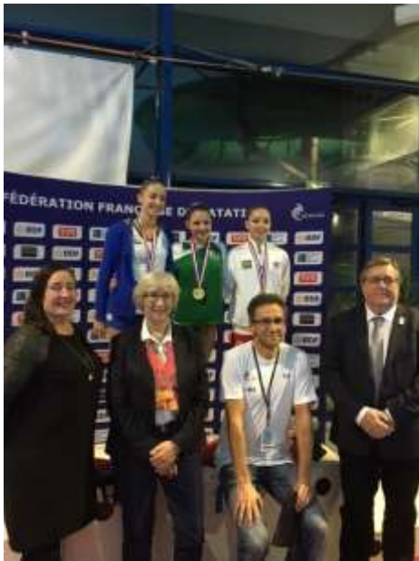
Podium « Solo Jeunes »