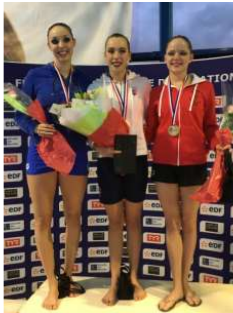
Podium « Solo Seniors »