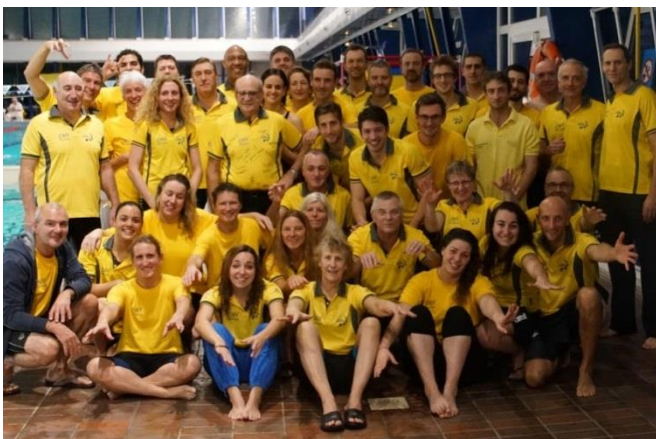
Club du CN Viry-Chatillon 1 er du classement par points des clubs d'Ile-de-France

Rendez-vous maintenant au championnat de France individuel qui se tiendra à Angers du 23 au 26 mars 2018. Nul doute que les clubs d'Ile-de-France sauront faire des merveilles.