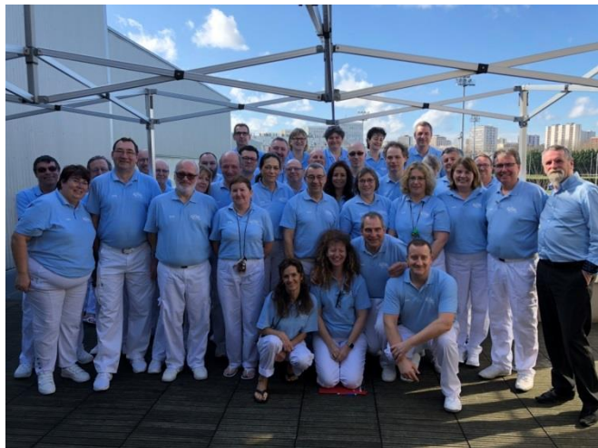
Jury du Golden Tour Paris – Sarcelles (mars 2018)