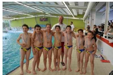
Podium U11 Excellence : CNLG