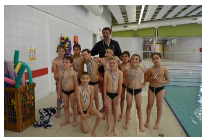
Podium U11 Promotionnel : ASVO