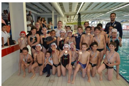
Champion U11 Excellence et U11 promotionnel : SCNCR

Prochaine session du pass compétition WP : le mercredi 27 juin 2018 à La Libellule de Paris à 19h30 piscine de Château Landon