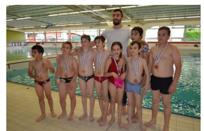
Podium U11 Promotionnel : TSN95