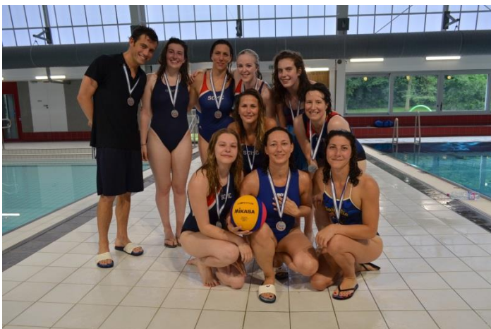
SCM Châtillon, Vice-championne Open Dame LIFN